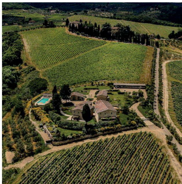
BOLGHERI - TENUTA FOLONARI