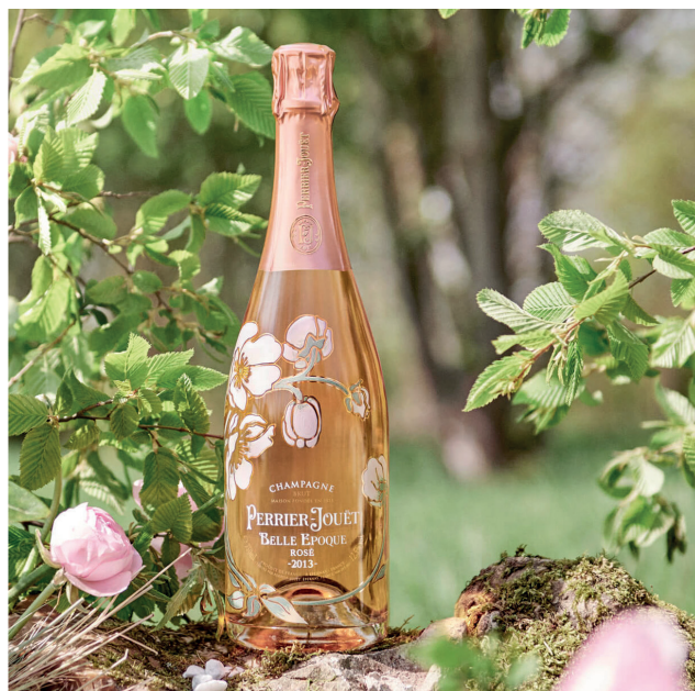
PERRIER-JOUËT - BELLE EPOQUE ROSÉ