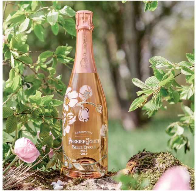
PERRIER-JOUËT - BELLE EPOQUE ROSÉ