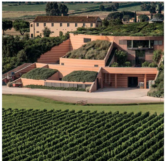
ANTINORI - FATTORIA LE MORTELLE