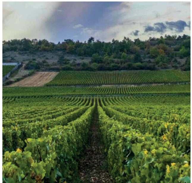
TENUTA VINICOLA "OLIVIER LEFLAIVE"